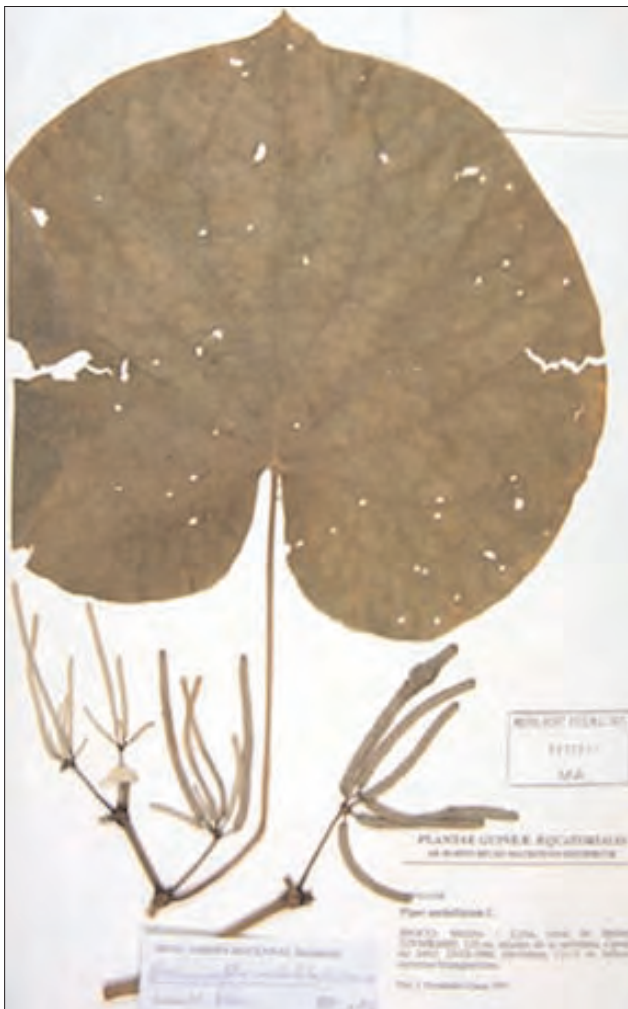
Un pliego de Guinea Ecuatorial conservado en MA

En los últimos 20 años el Real Jardín Botánico de Madrid viene desarrollando una intensa labor, sobre todo de campo, destinada a incrementar los fondos del herbario, con el objeto de afrontar la realización una flora moderna para Guinea Ecuatorial. Financiadas primero por la Agencia Española de Cooperación Internacional (AECI) y después gracias a sucesivos proyectos enmarcados en el programa de I+D del Ministerio de Educación y Ciencia (MEC), se han podido realizar hasta 10 campañas de recolección en territorio guineano. Fruto de los materiales reco-